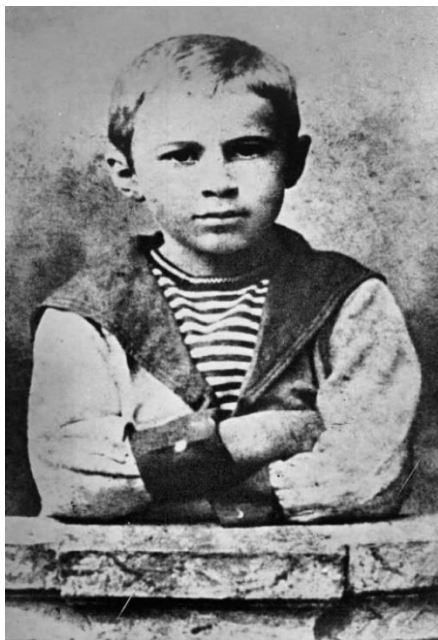
Serge Prokofiev (7 anos)

Uma obra também contemporânea do Concerto para Violino nº 1 onde, mais uma vez, encontramos uma vénia à tradição romântica