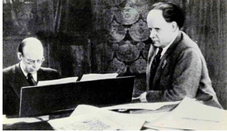
Prokofiev com o cineasta Eisenstein no épico 'Alexander Nevsky' (1938)