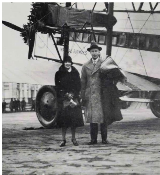
Serge Prokofiev com a mulher no Reino Unido (1927)

Nesse mesmo ano de 1929 concebeu ainda o Quarteto de Cordas nº 1 , uma encomenda da Biblioteca do Congresso em Washington. Pela frente teria ainda, a breve prazo, a composição de mais um bailado como forma de evocar a terra natal, e mais dois concertos para piano que constam hoje no panteão da música erudita do século XX. Isso e também a estória de Pedro e o Lobo serão os pontos cardeais do próximo episódio do compositor da semana